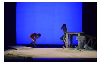
Réalisations de Thiphaine monroty qui m'inspirent.